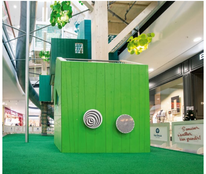
Idee: M. DE DREUZY

Die eigens für den großzügigen Eingangsbereich der IKEA-Filiale im französischen Bayonne entworfene Spielkonstruktion ist etwas ganz besonderes.